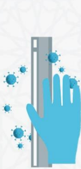
لمس الأسطح الملوثة

في الوقت الحالي، المصدر الأساسي المعروف لانتقال العدوى هو مُصابي الفيروس أنفسهم. ويمكن للمرض أن ينتقل من شخص إلى شخص عن طريق القطرات الصغيرة التي تتناثر من الأنف أو الفم عندما يسعل الشخص المصاب بمرض كوفيد-١٩ أو يعطس. وتتساقط هذه القطرات على الأشياء والأسطح المحيطة بالشخص. ويمكن حينها أن يصاب الأشخاص الآخرون بمرض كوفيد-١٩ عند ملامستهم لهذه الأشياء أو الأسطح ثم لمس عينيهم أو أنفهم أو فمهم.