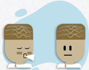
مخالطة المصابين بالفيروس